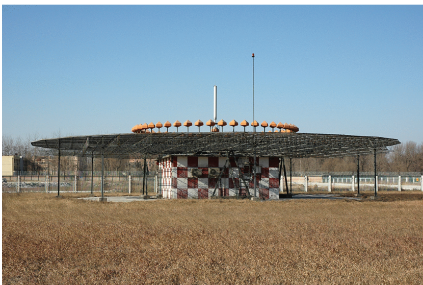
Seitenansicht einer DVOR-Anlage

Ergebnis: Die ausgewerteten Simulationsergebnisse sind die elektrische Feldstärke E und deren Feldlinien. Durch diese Ergebnisse lässt sich eine Aussage über die Verteilung des elektrischen Feldes im Raum machen. Mit den erhaltenen Simulationsergebnissen bezüglich des elektrischen Feldes konnten die Messfehler der Anlage, welche durch die Reflexionen der Gebäude entstanden, erfolgreich nachgewiesen werden. Jedoch war es nicht möglich, die exakten Werte der Abweichung zu ermitteln.