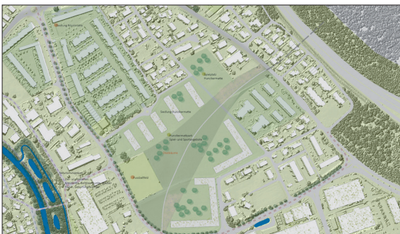
Ausschnitt aus dem Konzeptplan im Bereich Hunzikermatte

Ziel der Arbeit: Mit dem Freiraumkonzept sollen langfristig Freiräume gesichert und es soll eine übergeordnete Freiraumstruktur geschaffen werden. Das Freiraumkonzept setzt für die nächsten 10 bis 15 Jahre übergeordnete Ziele in der Freiraumentwicklung. Buchs soll ein vielfältiges Erholungsangebot mit hoher Qualität aufweisen. Weiter werden mit dem Freiraumkonzept ein intaktes Siedlungsbild und eine hohe ökologische Vielfalt angestrebt.