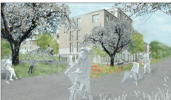
Siedlungsgeprägter Freiraum Hunzikermatte

Ergebnis: Mit der Umsetzung des Freiraumkonzepts wird der Suhrraum zu einem attraktiven linearen Freiraum. Die Kernstücke sind der Suhrepark, wo Aufenthaltsorte direkt am Wasser ermöglicht werden, sowie der Naturraum mit einer Auenlandschaft, welche das Naturbeobachten ermöglicht. Ein weiteres Element ist der Grünzug, der zwei wichtige Naherholungsgebiete miteinander verbindet. Er weist sowohl von Siedlungen wie auch von der Landschaft geprägte Bereiche auf. Blumenwiesen und Obstbäume ziehen sich durch den gesamten Grünzug und schaffen ein verbindendes Element. Daneben wird die Sicherheit und Aufenthaltsqualität der Strassenräume verbessert, um attraktive lineare Freiräume zu schaffen. Mit Pocket Parks wird die Freiraumversorgung in den Quartieren sichergestellt. Sie schaffen Freiräume in der Nähe des Wohnumfelds, welche besonders für Kinder, Familien und ältere Leute wichtig sind. Mit diesen Elementen erhält die Gemeinde Buchs eine klare Freiraumstruktur und attraktive Erholungsräume.