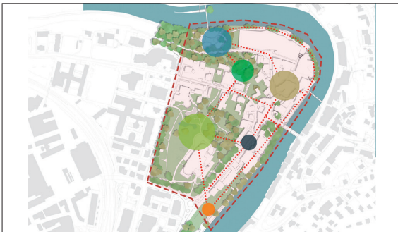
Vision «Stadtspark Baden Nord»