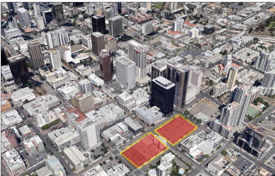
Perimeter und Umgebung

Ergebnis: Dieser Park soll für die Stadt San Diego neuartig sein und sich von den bereits bestehenden unterscheiden. Die meisten Parks, zum Beispiel der Balboa-Park, sind zwar gross, aber für die Arbeitenden sehr weit entfernt und in der kurzen Mittagspause, die zur Verfügung steht, nicht zu Fuss erreichbar. Ebenso gibt es viele Parks, die vor allem auf Kinder ausgerichtet sind. Das ist wichtig und hat in einer so grossen Stadt durchaus seine Berechtigung, ist hier aber nicht mehr nötig. Der neue Bambuspark soll vor allem dazu dienen, sich zu entspannen und in sich hineinzuhorchen.