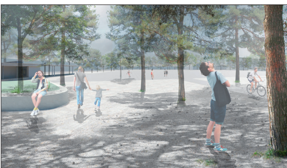
Blick von Nordosten in Richtung Platz. Das Baumdach schafft eine angenehme Atmosphäre und lädt zum Aufenthalt ein.

Ausgangslage: Der Teuchelweiherplatz liegt im südwestlich an die Altstadt angrenzenden Gebiet Zeughaus-Teuchelweiher in Winterthur. Zurzeit wird der Platz für unterschiedlichste Veranstaltungen genutzt. So finden das jährliche Gastspiel des Zirkus Knie oder die Afrikatage und andere kleinere Events statt. Durch den Bau eines unterirdischen Parkhauses bietet sich die Chance, an zentraler Lage einen attraktiven Freiraum zu gestalten, der das ganze Quartier aufwertet.