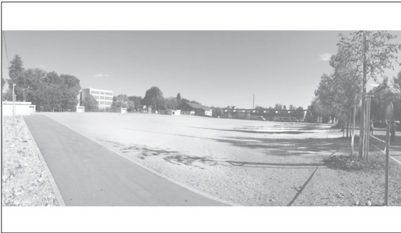
Momentan hat der Platz einen brachenartigen Charakter. Er fällt vor allem durch seine Grösse und die weite Raumwirkung auf.