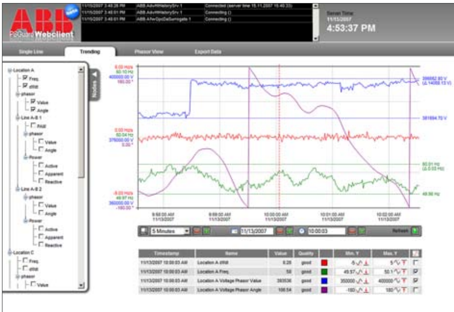
Grafische Auswertung von Messdaten

gen Internet-Browsern werden vier Hauptfunktionen von PSGuard implementiert. Diese sind: eine Übersicht über den aktuellen Netzzustand, Warn- und Alarm-Meldungen, grafische und tabellarische Auswertung von gespeicherten Messdaten sowie Export von Daten in CSV-Dateien.