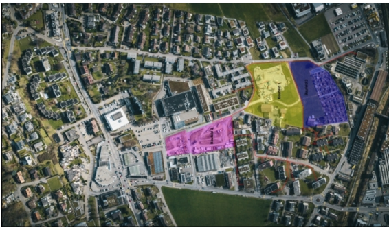
Drohnaufnahme des Gebiets des geplanten Anergienetzes mit ARA