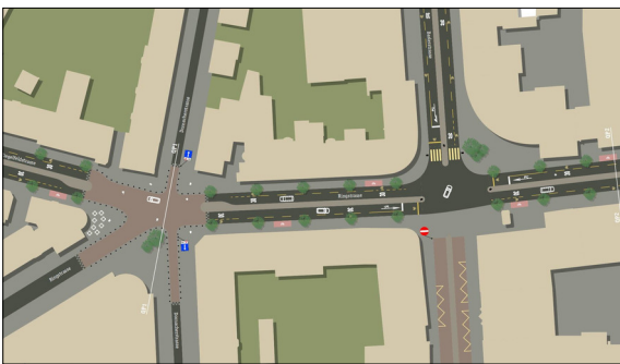
Ausschnitt aus dem neuen Betriebs- und Gestaltungskonzept Eigene Darstellung auf Grundlage Amtliche Vermessung Kt. SO

Einleitung: Die heutige Verkehrssituation in Olten ist trotz guter Voraussetzungen für Fuss- und Radverkehr (FRV) durch die starke Verkehrsbelastung infolge des motorisierten Individualverkehrs (MIV) geprägt. Die Hauptverkehrsachsen, welche die Verbindungen zu den verschiedenen Gemeinden sicherstellen, kommen bereits heute in den Spitzenstunden an ihre Kapazitätsgrenzen. Durch die erwartete Bevölkerungsentwicklung in den kommenden Jahren wird es zu einer weitergehenden Überlastung des Strassennetzes kommen. Für den FRV besteht besonders im Hauptstrassennetz (Kantonsstrassen) fast durchgängig eine geringe Aufenthaltsqualität. Dies ist vor allem so, da neben der rein zahlenmässig hohen Belastung die Strassenraumgestaltung vom MIV dominiert wird. Dementsprechend existiert dort eine oft geringe Verkehrssicherheit für den FRV.