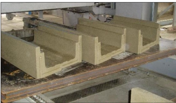
Ausgestossene Kabeltröge aus erdfeuchtem Beton Unterlagen Creabeton Produktions AG

Ergebnis: Alle relevanten Vorgaben und Anforderungen an das Produkt konnten zusammengetragen und mit entsprechenden Verweisen, wie z. B. Normen ergänzt werden. Eine Bedarfsanalyse aus Sicht der Bahnunternehmung der SBB wurde durch die SBB abgegeben und mit einer Auswertung in die Arbeit integriert. Anhand eines Variantenstudiums konnten mögliche technische Innovationen erarbeitet, analysiert und mittels einer Nutzwertanalyse auf ihre Machbarkeit überprüft werden. Dabei wurde ein besonderes Augenmerk auf die Kosten und die Nachhaltigkeit der Varianten gelegt und entsprechende Vergleiche gezogen. Aufgrund der Ergebnisse der Analyse und diverser Gespräche mit dem Hersteller kristallisierte sich vor allem die Variante der Produkterzeugung aus erdfeuchtem Recyclingbeton mittels Brett- und Kippfertigmern heraus. Optimierungen an der Bauteilgeometrie sind jedoch aufgrund der engen Vorgaben der SBB nur bedingt möglich.