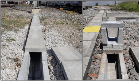
Kabelschutzbauteile aus Beton im Gleisbereich

Einleitung: Um diverse Strom- und Kommunikationskabel entlang der Bahnstrecke sicher unterzubringen, verbaut die Bahnunternehmung SBB Kabelkanäle mit Deckeln, welche sie derzeit von einem einzigen Schweizer Hersteller bezieht. Die Kabelkanaltypen, welche bei der SBB zum Einsatz kommen, sind bereits seit mehreren Jahren auf dem Markt und hatten weder in der Mechanik noch in der Gestaltung je eine Änderung erfahren. Da die SBB einen zweiten Hersteller solcher Betonprodukte sucht, plant ein Hersteller aus der Ostschweiz, sich als zweiten Hersteller bzw. Lieferanten bei der SBB zu qualifizieren.