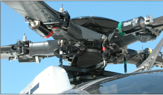
Taumelscheibe und Rotor eines MD500 in Realität... www.rotorfixnz.com