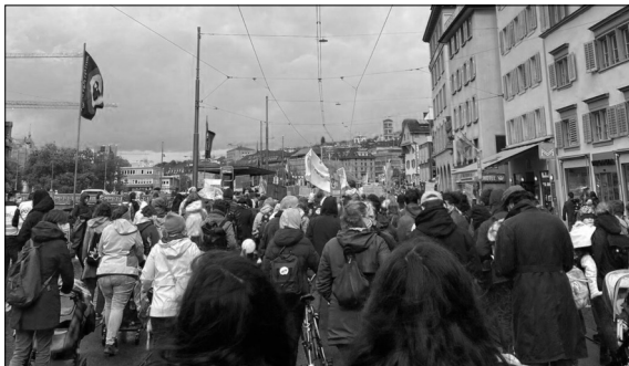
Demonstrationszug 2020 entlang des Limmatquai, Zürich Eigene Darstellung