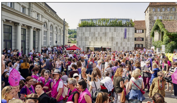
Frauenstreik 2019 auf dem Schlossplatz, Aarau Colin Frei, 2019

Ausgangslage: Der Zusammenhang zwischen Freiraum und Politik ist vielleicht nicht auf den ersten Blick erkennbar. Doch mit der vorliegenden Arbeit soll aufgezeigt werden, wie eng die beiden Themen verknüpft sind. Bereits die Wiege unserer Demokratie im antiken Griechenland ist stark mit dem Freiraum verbunden. Auch zweitausend Jahre später braucht eine funktionierende Demokratie den öffentlichen Raum als Ort, um das Zusammenleben auszuhandeln und Unmut sichtbar zu machen. Planer*innen des Freiraums spielen eine zentrale Rolle, wenn es darum geht den Freiraum für alle zugänglich zu machen.