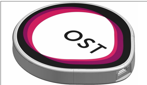
Abbildung 2: Give-away montiert, IML-Folie mit OST-Logo hinterspritzt (IML: In Mould Labeling) Eigene Darstellung

Aufgabenstellung: Im Rahmen dieser Bachelorarbeit soll ein Give-away mit spannender Funktionalität entwickelt werden, womit die Zusammenarbeit der drei Standorte der neuen Fachhochschule OST aufgezeigt werden kann. Der Standort Rapperswil repräsentiert den Bereich Kunststofftechnik, weshalb dieser sowohl für die kunststoffgerechte Entwicklung des Giveaways als auch für das dazugehörige Spritzgiesswerkzeug zuständig ist. Da das Give-away als Werbeobjekt dienen wird, soll eine Folie mit dem neuen OST-Logo hinterspritzt werden.