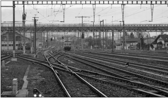
Gleisfeld Bahnhof Rapperswil

Ausgangslage: Aufgabe in der vorliegenden Arbeit war es, eine mögliche Entwicklung des Gebietes rund um das Gleisfeld in Rapperswil aufzuzeigen. Als Grundlage dienten dazu 10 Entwürfe zum Gebiet aus einem Städtebaumodul des Bachelorstudiengangs Raumplanung, welche es zu synthetisieren und weiter zu entwickeln galt. Die Grundidee war es, an dem Expertenpool (bestehend aus den Raumplanungsstudenten) Hauptnutzungen und –massnahmen in den Entwürfen zu identifizieren und mit einer Synthese eine Bestvariante aus ihren Projekten zu erstellen. Zusätzlich wurden die planerischen Rahmenbedingungen, aktuelle Projekte und eine ausgedehnte Analyse in den Bereichen Städtebau, Freiraum und Verkehr vorgenommen, um die Ergebnisse der Synthese zu validieren und mit weiteren Aspekten – insbesondere bezüglich Freiraum – anzureichern.