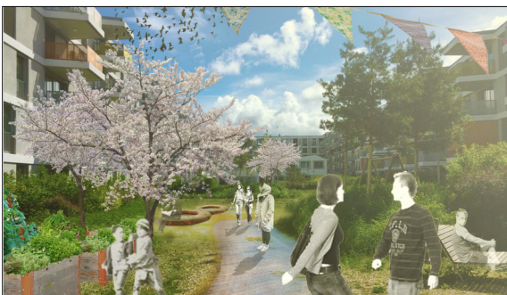
Mögliches Zielbild für das Schlüsselgebiet "Südquartier" Eigene Darstellung