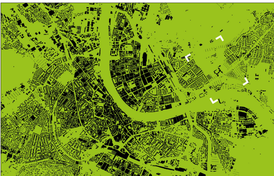
Das Gebiet Basel-Ost zwischen der Stadt Basel und der Gemeinde Riehen.

Ergebnis: Die Erkenntnisse des Analyseteils führten zum Ergebnis, dass hauptsächlich die Typologie der vorgeschlagenen Hochhausbebauung und der fehlende Mitwirkungsprozess zum Widerstand in der Bevölkerung geführt haben. Weitgehend unumstritten ist allerdings die Entwicklung des Ortes für eine bessere Freiraum- und Erholungsnutzung. Der ausgearbeitete Projektvorschlag zeigt deshalb einen möglichen Beteiligungsprozess der Bevölkerung auf und entwickelt den Ort aus dem Freiraum heraus.