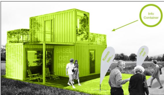
Der Partizipationsprozess beinhaltet die Information der Bevölkerung in Info-Containern vor Ort.

Einleitung: Die Arbeit befasst sich mit den Gründen und den Ursachen für das Scheitern des Vorschlags für die Stadtrandentwicklung Basel-Ost durch den Regierungsrat des Kantons Basel-Stadt im Rahmen seiner Zonenplanrevision. Durch die intensive Auseinandersetzung mit den politischen und gesellschaftlichen Prozessen und dem Ort Basel-Ost werden Anknüpfungspunkte für ein neues Projekt gesucht.