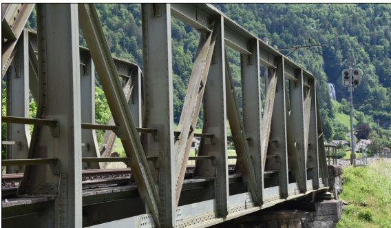
Blick Richtung Diesbach Eigene Darstellung