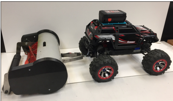
Abbildung 2: Montierter "Rasenfräser"-Prototyp

Ziel der Arbeit: Das Ziel dieser Bachelorarbeit ist die Entwicklung eines semiprofessionellen Tools für Erwachsene, mit welchem der Rasen ferngesteuert gemäht werden kann. Dieser soll, anders als die Rasenmäher oder Rasenroboter, den Rasen mit einer hohen Geschwindigkeit mähen können. Der Rasenschnitt soll so ausgeworfen werden, dass dieser nicht mehr eingesammelt werden muss. Dies soll dem Bediener Freude bereiten und Begeisterung aufkommen lassen. Mit diesem Prototyp soll die Umsetzbarkeit des Konzepts überprüft werden.