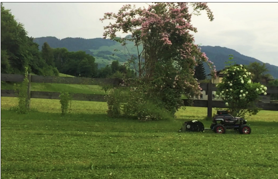
Abbildung 3: "Rasenfräser" während des Einsatztests

Ergebnis: Das Ergebnis ist ein "Rasenfräser"-Prototyp bestehend aus einem ferngesteuerten Fahrzeug und einem angetriebenen Spindelmäher. Der Spindelmäher wird mit einer Geschwindigkeit von mehr als 6 km/h über den Rasen gezogen. Diese Mähgeschwindigkeit ist, im Vergleich zu einem Rasenmäher oder Rasenroboter, einiges höher und verkürzt damit die Zeit zum Mähen. Das Schnittergebnis ist trotz einiger Schwächen am Prototyp sehr zufriedenstellend. Insgesamt können mit dem vorliegenden Prototyp circa 400 m 2 Rasenfläche in 20 Minuten gemäht werden. Während des Rasenmähens mit dem Rasenfräser kommt beim Bediener grosse Begeisterung auf.