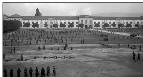
Der Zeughaushof bildet durch temporäre Zwischenlösungen einen attraktiven Quartierraum.

Bebauungsstruktur und die Anbindung des Areals. Die dritte Ebene wird aus den ökologischen und stadtklimatischen, sowie sozialen Kriterien zusammengesetzt. Daraus können Konzeptbausteine formuliert werden, die in unterschiedlichem Masse und Dauer die Gesamtanlage bespielen und sie so zu einem multifunktionalen und langlebigen Freiraum werden lassen, der sich adaptiv den zukünftigen Veränderungen des Areals anpasst. Veränderung des Freiraums durch Stationen 4 und die Exerzierwiese zur Zeit des Ersten Weltkriegs. https://kreis4unterwegs.ch/stationen/kaserne/