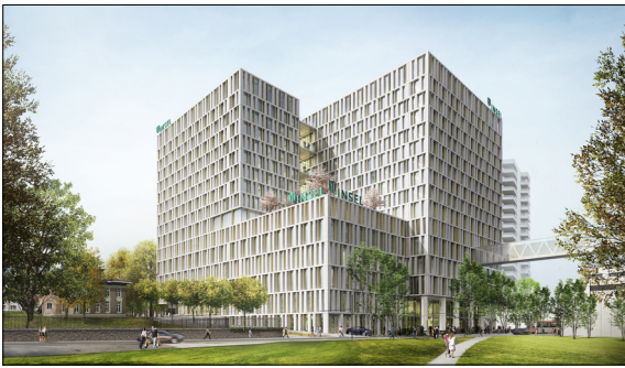
Abb. 1 Visualisierung des Neubaus Spitalgebäude BB12 des Inselspitals

Ziel der Arbeit: Der Neubau Spitalgebäude BB12 des Inselspitals Bern wird in einem Simulationsmodell abgebildet und eine passende Regelstrategie zur Optimierung des Lastmanagements entwickelt. Das Lastmanagementkonzept soll unter Berücksichtigung der elektrischen Lasten für Beleuchtung, Geräte und Klimakälte das Potenzial der Spitzenlastreduktion durch Verschiebung der Klimatisierungslasten aufzeigen. Neben der energetischen Betrachtung bei Glättung der Stromleistungsspitzen werden auch die Ersparnisse der monatlichen Energiekosten durch das Lastmanagementkonzept untersucht.