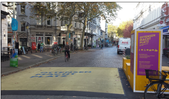
Umgesetzte Anwendung: Flanierquartier auf Zeit Eigene Darstellung

Einleitung: Das Schweizer Mobilitätssystem steht vor vielfältigen Herausforderungen wie zunehmende Kapazitätsengpässe sowie steigende Ansprüche der Mobilitätskunden. In diversen Strategien ist festgelegt, wie diesen Herausforderungen grundsätzlich zu begegnen wäre. Eine Übersicht mit Ansätzen für die praktische Umsetzung und ein Überblick über neuartige Mobilitätslösungen fehlt jedoch. Hier setzt die Masterarbeit an: Neue Ansätze für die urbane Schweiz werden vorgestellt und die zukünftige Verkehrssituation aufgezeigt. Erwartet wird eine weitere Zunahme der Verkehrsleistung und eine Verschärfung der Nachfragespitzen. Zusätzlich bestehen Trends wie aktive, geteilte und nahtlose Mobilität, welche zukünftige Bedürfnisse und Angebote prägen werden. Mobilität wird vermehrt als Dienstleistung betrachtet.