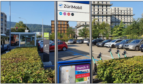
Zukünftige Ausgangslage: Mobilität wie ich will Eigene Darstellung

Einleitung: Das Schweizer Mobilitätssystem steht vor vielfältigen Herausforderungen wie zunehmende Kapazitätsengpässe sowie steigende Ansprüche der Mobilitätskunden. In diversen Strategien ist festgelegt, wie diesen Herausforderungen grundsätzlich zu begegnen wäre. Eine Übersicht mit Ansätzen für die praktische Umsetzung und ein Überblick über neuartige Mobilitätslösungen fehlt jedoch. Hier setzt die Masterarbeit an: Neue Ansätze für die urbane Schweiz werden vorgestellt und die zukünftige Verkehrssituation aufgezeigt. Erwartet wird eine weitere Zunahme der Verkehrsleistung und eine Verschärfung der Nachfragespitzen. Zusätzlich bestehen Trends wie aktive, geteilte und nahtlose Mobilität, welche zukünftige Bedürfnisse und Angebote prägen werden. Mobilität wird vermehrt als Dienstleistung betrachtet.