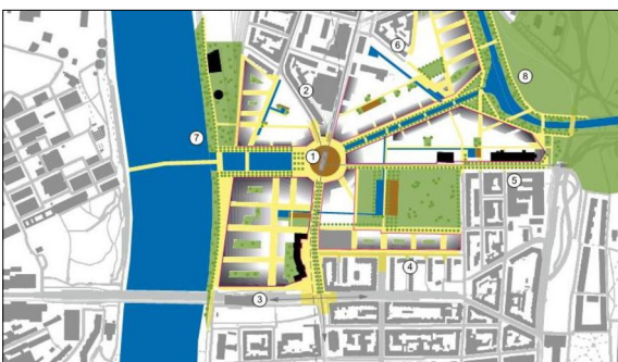
Gesamtkonzept Eigene Darstellung

In einem nächsten Schritt wird das erlangte Wissen über das Gebiet und den aktuellen Stand der Planung Synthetisiert. In Form von ausgewiesenen Teilgebieten und Hauptnutzungen für den Perimeter sollen die Potentiale und Defizite sowie der Handlungsspielraum aufgezeigt werden. Aufbauend werden die Hauptmassnahmen der Testbeiträge durch fehlende Massnahmen meiner Schwerpunktthemen Klima und Wasserhaushalt ergänzt. Gleichzeitig wird aufgezeigt mit, welchen Ökologischen Massnahmen man die aktuelle Planung „Aufwerten“ muss um die Ziele zu erreichen. Darauffolgend wird ein Leitbild ausgearbeitet, welches die Grundlage für das Konzept bildet. Abschliessend wird das Fazit erarbeitet, welches die mögliche Zukunft des Quartiers in Bezug auf die Kriterien der Ökologie zeigt und mit welchen Massnahmen dies im Planungsprozess erreicht werden soll.