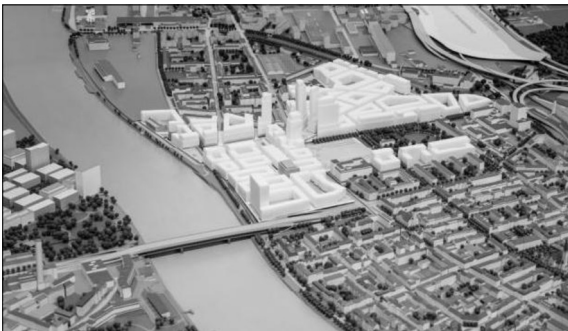
Testplanungsbeitrag - Team Kollhoff Schlussbericht Testplanung - Klybeckplus

Vorgehen: Als erster Schritt werden die Grundlagen aufgearbeitet. Dabei wird der zu untersuchende Bereich bestimmt und dessen Einbindung untersucht. Fortgefahren wird mit einer vertieften Analyse des Gebietes anhand der Überthemen Freiraum, Ökologie, Verkehr sowie Städtebau. Des Weiteren, werden die bereits erarbeiteten Studien von AS+P, Diener&Diener, Kollhoff und OMA zusätzlich zu der herkömmlichen Analyseverfahren auf die drei Schwerpunktthemen systematisch untersucht und bewertet.