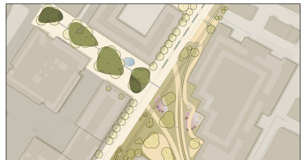
Leitgedanke: die Westseite für den Menschen und die Ostseite für die Natur, Lichtkorridore als Querungshilfen Eigene Darstellung