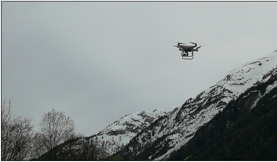
Drohne im Einsatz

Einleitung: Die Alpine Rettung Schweiz (ARS) leistet terrestrische Einsätze für in Not geratene und hilfsbedürftige Menschen im alpinen, voralpinen und schwer zugänglichen Gebiet der Schweiz und dem angrenzenden Ausland. Die Ausgangslage dieser Bachelorarbeit beruht auf der Studienarbeit „Einsatzplanung und Tracking von alpinen Rettungsaktionen mit Hilfe GPS“, welche den Schwerpunkt auf die Einsatzplanung, das Tracking und die Suche zu Fuss legte.