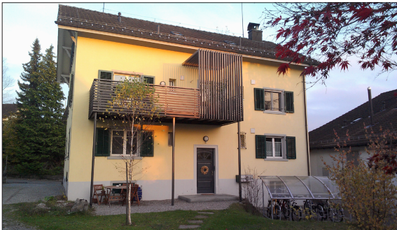
Untersuchtes Gebäude in Stäfa, erbaut 1893

Einleitung: In der Bachelorarbeit wurde der energetische Zustand einer Liegenschaft in Stäfa untersucht und mögliche Sanierungsoptionen aufgezeichnet. Aufgrund der Gebäudehistorie und vorgenommener Messungen wurden die Ausgangsdaten der Gebäudehülle zusammengestellt und anhand der SIA 380/1 energetisch bewertet. Parallel wurden mögliche Verbesserungen der Gebäudetechnik analysiert.