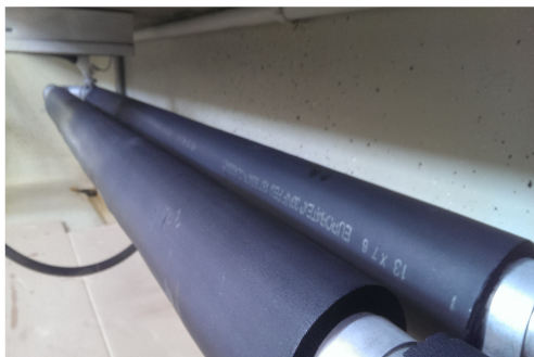
Isolation der Rohrleitungen

Fazit: Es wurde nachgewiesen, dass sich eine Rohr-Isolierung finanziell nur bei hohen Energiepreisen lohnt und die Amortisierung dann immer noch ca. 6 Jahre umfasst. Im Vergleich hat sich herausgestellt, dass das System der FAT mehr Energie verbraucht, aber aufgrund der tieferen Energiepreise trotzdem tiefere Kosten hat. Bei einer thermischen Solaranlage mit 8 m 2 Kollektorfläche müsste sogar mit ca. 20 Jahren Amortisationszeit gerechnet werden.