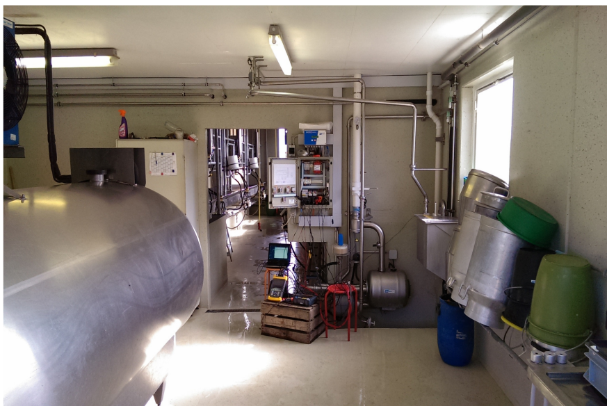
Melkanlage auf dem Bauernhof