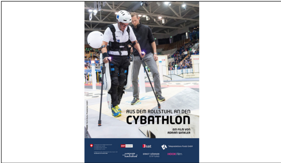
Dokumentarfilm: Schritt für Schritt – aus dem Rollstuhl an den Cybathlon https://hook-film.com/aus-dem-rollstuhl-an-den-cybathlon/