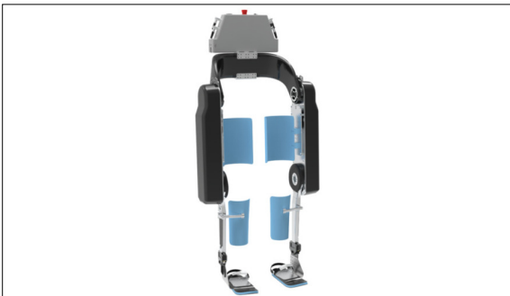
VariLeg Enhanced https://www.varileg-enhanced.ch/exo/