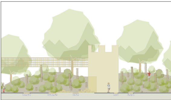
Spielhügel mit Spielturnm