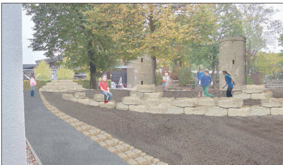
Die Burg im neuen Glanz

Ausgangslage: Die Gemeinde Küssaberg liegt direkt am Hochrhein in der Mitte zwischen Basel und dem Bodensee, etwa 8 km von der Kreisstadt Waldshut-Tiengen entfernt. Küssaberg besteht aus sieben Ortsteilen: Bechtersbohl, Dangstetten, Ettikon, Kadelburg, Küssnach, Reckingen und Rheinheim. Der Pausenhof der Grundschule Kadelburg bietet den Kindern aus der Umgebung keine besonderen Attraktionen und entspricht auch nicht den heutigen Spielstandards und Gestaltungsbereichen. Das gesamte Projekt orientiert sich am Thema Küssaburg, da die Burg an höchster Stelle in der Gemeinde liegt.