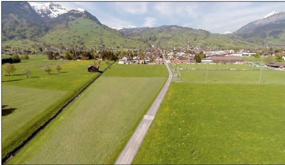
Drohnenaufnahme des Baugrundstücks in Richtung Grabs Dorf

Ausgangslage: In der Gemeinde Grabs im St. Galler Rheintal besteht schon seit einiger Zeit das Bedürfnis nach einem Badeweiher. Der Förderverein «Badesee», die Hallengossenschaft sowie die politische Gemeinde unterstützen das Projekt einer öffentlichen Anlage. 2015 wurde eine Machbarkeitsstudie in Auftrag gegeben. Darin wurden alle möglichen Standorte untersucht und dann fünf Standorte genauer evaluiert. Schliesslich wurden zwei Standorte ausgewählt, die für das Bauvorhaben infrage kommen.