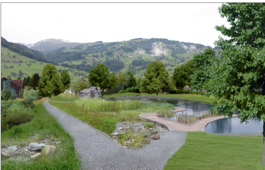
Stimmungsbild des Badeweiher