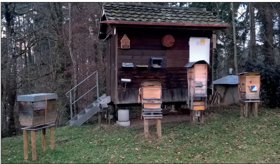
Die Bienenstöcke stehen auf Waagen, die über einen Controller der FPGA Company mit dem Internet verbunden sind