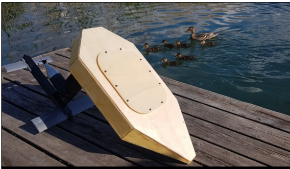
Sperrholz-Modellboard nach erfolgreichem Test

Ergebnis: Es wird ein Modellboard aus Sperrholz mit 3D-Druck-Mast und -Flügel entwickelt, konstruiert und gefertigt. Dieses hat den geometrischen Massstab 1:3. Zur Überprüfung von Veränderungen am Modellboard oder dem Regler wird ein mathematisches Modell gebildet. Mittels Nachschlagetabellen sind die Flügelprofil-spezifischen und Anstellwinkel-abhängigen Beiwerte hinterlegt. Somit kann jeder Betriebspunkt modelliert werden.