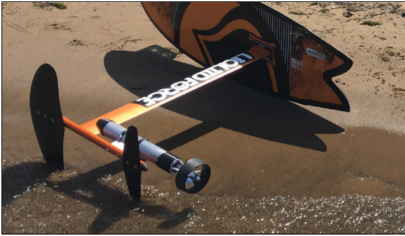
Ausgangslage: Tragflächen-Surfbrett mit angebrachtem Elektromotor

Ausgangslage: Im Jahr 2017 haben vermehrt Freizeitsport-Tüftler elektrische Antriebe an ihre gekauften Tragflächen-Surfbretter montiert. Diese Surfbretter sind jedoch sehr schwer zu kontrollieren, da sie keinerlei Regelung besitzen.