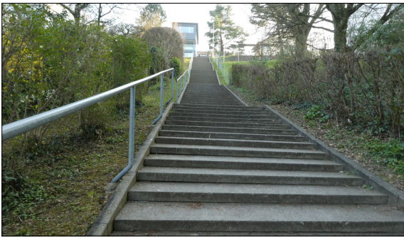
Höhendifferenz im Siedlungsgebiet, Steinacherweg Wädenswil Eigene Darstellung