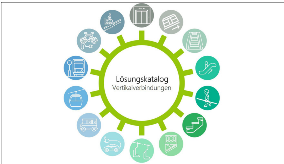
Lösungskatalog Vertikalverbindungen Eigene Darstellung