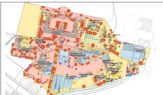
Schutzwertplan der UPD Bern Eigene Darstellung

Ergebnis: Die Anlage stellt sowohl aus sozialhistorischer- wie auch aus kulturhistorischer Sicht eine Besonderheit dar, da sie, an einem Standort, die medizinische Entwicklung seit dem 15. Jahrhundert aufzeigen kann. Diese schrittweise Entwicklung ist noch sichtbar, da um die einzelnen Gebäude eigene Gartenanlagen erstellt wurden und noch heute diese Ansammlungen erlebbar sind. In den 1970er Jahren wurden die einzelnen Anlageteile, durch eine Gestaltung des Gartenarchitekten Ernst Surbeck, miteinander verbunden. Er bediente sich dabei typischer Elemente der Nachkriegsmode und in seinen späten Interventionen auch postmoderner Ansätze. Das Besondere der Anlage sind ihre offenen Freiräume, die durch Surbecks gezielten Einsatz von Baumpflanzungen und einer sanften Modellierung des Geländes erreicht werden. Dadurch entsteht eine Anlage, in der verschiedene gartengeschichtlich, interessante oder hochwertige Anlagen in ein Gesamtkonzept eingebettet sind. Als solches gilt es die Spital-Anlage aufgrund ihres Konzeptes und der landschaftsarchitektonischen Qualitäten zu schützen.