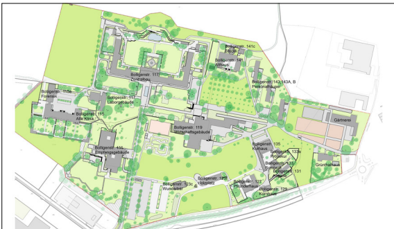
Bestandsplan der UPD Bern Eigene Darstellung

Vorgehen: Mit dem Ziel eine gartendenkmalpflegerische Bewertung über das gesamte Areal zu erstellen, wird ein Parkpflegewerk erstellt, das Handlungsspielräume für die Weiterentwicklung der Anlage aufzeigt. In diesem Bericht werden Themen wie die rechtlichen Rahmenbedingungen, vorhandene Inventare, die Nutzungsplanung, der Unterhalt und die Nutzung der Anlage aufgeführt. In einem weiteren Schritt wird die Entwicklungsgeschichte der Anlage recherchiert und in einzelne für den Aussenraum prägende Phasen eingeteilt. Bei der Bestandsaufnahme wird der Ist-Zustand der Anlage in einem Plan dargestellt und die einzelnen Anlageteile werden beschrieben. Eine fotografische Dokumentation hält den vorgefundenen Zustand der heutigen Anlage fest. Mithilfe dieser Grundlage wird die Anlage bewertet und ihr Schutzwert festgelegt. Abschliessend wird ein Leitbild entwickelt und die schützenswerten Qualitäten beschrieben.