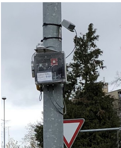
Sensorbox mit Regen-, Sonneneinstrahlungs-, Boden- und Luftfeuchtigkeit, Boden- und Lufttemperatursensoren.

Das Projekt wurde von Innosuisse gefördert und vom Institut für Produktdesign, Entwicklung und Konstruktion (IPEK) geleitet, unterstützt wurde es vom Institut für Energietechnik (IET) und vom Institut für Landschaft und Freiraum (ILF) der OST. Zusätzliche Projektpartner waren Regio Energie Amriswil REA, die Styromat AG und die Hawle Armaturen AG.