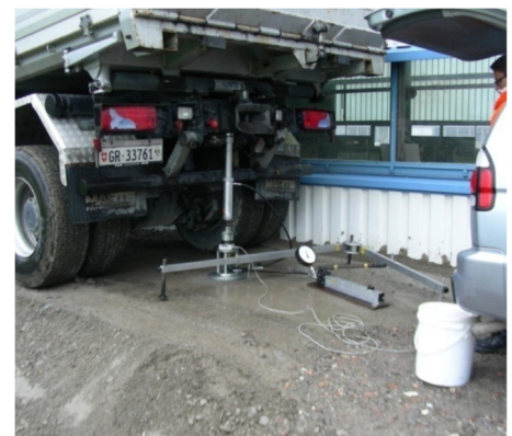
Abb. 1: Festigkeitsbestimmung beim Prüfkörper im Labor und Messung des ME-Wertes in einem Feldversuch.