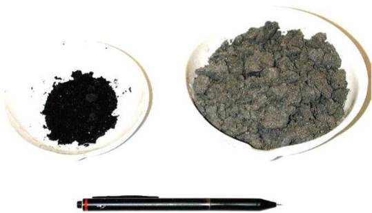
Abb. 2: Dioxin-Konzentrat (links) und «saubere» Filterasche (rechts).

Der Kern des exDIOX-Verfahrens besteht in einer Flootation der Filterasche. Hierbei werden die in der Filterasche enthaltenen dioxinhaltigen Russpartikel vom mineralischen Aschenmaterial abgetrennt und in einem Konzentrat ausgebracht. Dieses Konzentrat wird in die Verbrennung zurückgeführt, wodurch das Dioxin zerstört wird. Der Rückstand ist eine dioxin- und schwermetallabgereicherte mineralische Fraktion.