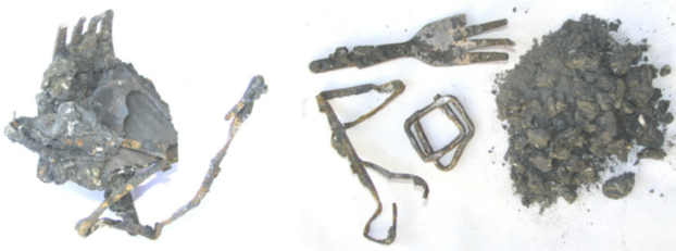
Abb. 3: Eingeschlossene Metallstücke (links) und von der Schlacke freigelegte Metallstücke (rechts).

Trotz der Metall-Separatsammlung gelangt der grösste Teil der Metalle aus unseren Haushalten in den Abfall und damit in die Kehrlichtverbrennungsanlagen (KVA). Der überwiegende Teil dieser Metalle verbrennt allerdings nicht, sondern wird mit dem Rückstand der Kehrlichtverbrennung, der Rostasche (= «Schlacke»), aus dem Ofen ausgetragen. Am UMTEC wurde eine Methode entwickelt, um den Gehalt an Nichteisenmetall in solchen Schlacken zuverlässig zu bestimmen. Die Methode beruht auf dem Prinzip der «selektiven» Zerkleinerung. Hierbei wird ausgenutzt, dass bei mechanischer Beanspruchung die spröden mineralischen Schlackenbestandteile («selektiv») pulverisiert werden, während die Metalle allenfalls geringfügig verformt werden. Die „UMTEC-Methode“ gilt nicht nur in der Schweiz als Standard zur Bestimmung der Metallgehalte von Verbrennungsschlacken.