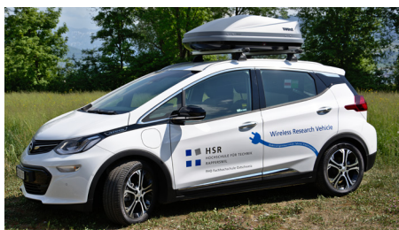
Aussenansicht Wireless Research Vehicle (Opel Ampera-e)