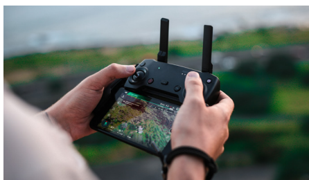
Feldversuche für Forschung und Entwicklung