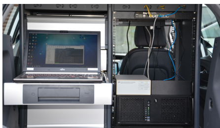
Laborarbeitsplatz im Kofferraum