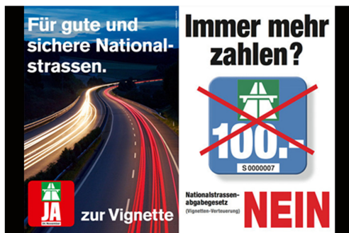
Abstimmungskampagne 2013 Referendum gegen die Änderung des Bundesgesetzes über die Abgabe für die Benützung von Nationalstrassen

Ausgangslage: Interessengruppen haben in der Schweiz eine grosse Bedeutung. Das politische System räumt den Bürgern und Bürgerinnen und ihren Interessenvertretungen viele Möglichkeiten zur Mitwirkung ein. Dies geschieht unter anderem über Initiativen, Referenden und Vernehmlassungen. Es gibt eine Vielzahl an Interessengruppen welche sich mit Verkehrsthemen beschäftigen. Darunter fallen etwa nicht nur die bekannten Verkehrsclubs sondern auch Institutionen welche sich mit einer nachhaltigen Verkehrspolitik beschäftigen oder auch jene, welche die Interessen mobilitätseingeschränkter Verkehrsteilnehmer vertreten. Interessengruppen nehmen insbesondere bei nachhaltigen Planungstätigkeiten eine wichtige Rolle ein, da sie bei Partizipationsprozessen als Stellvertreter und Sprachrohr der Bürger agieren können.