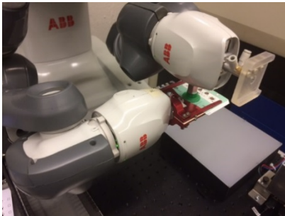
Einsatz kollaborativer Roboter „YuMi“

Aufgabenstellung: Kollaborative Roboter zeichnen sich durch einen hohen Sicherheitsstandard aus. Dabei entfällt die Notwendigkeit einer Schutzumhausung durch integrierte Überwachungssensoren. Mit kollaborativen Robotern wird somit eine direkte Zusammenarbeit von Mensch und Roboter ermöglicht. Mit dem Roboter „YuMi“ von ABB sind die intelligente Teileerkennung und die entsprechende Greiferstrategie auf dessen Fähigkeiten zu untersuchen. Dabei sollen Objekte, welche sich in einer ungenauen Lage befinden, identifiziert und gegriffen werden können. Schliesslich sind die Objekte an exakten Positionen abzulegen.