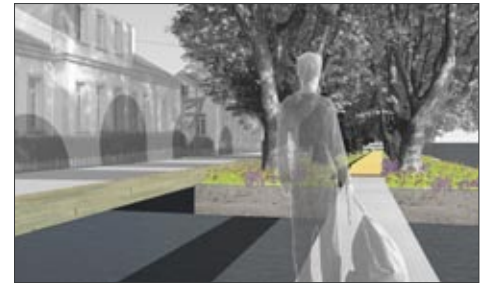
Steg zur Insel