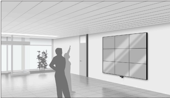
Visualisierung der Videowall an der HSR