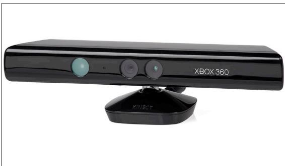
Microsoft Kinect