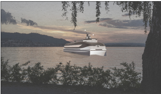
Visualisierung "Potentiale des Schiffsverkehrs zur Entlastung der Zürcher Innenstadt vom Durchgangsverkehr" S.Kelemen, Grundlagen von MCE Maritime CleanTech und PixHere

Problemstellung: Die Problemlage, nämlich die Überlastung der Zürcher Innenstadt, gründet auf der Problematik der Aufteilung von Wohn- und Arbeitsort. Eine starke Trennung zwischen Arbeitsplätzen und Wohnorten führt seit der Nachkriegszeit zu wachsendem Verkehrsaufkommen und einer stark transportorientierten Überlastung der Strassenräume im Ballungsraum.