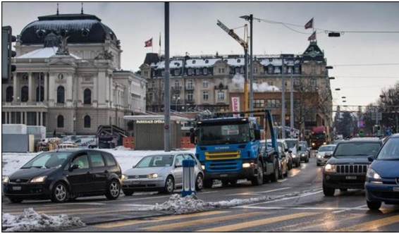
Stau am Verkehrsknotenpunkt Bellevue

Aufgabenstellung: Die vorliegende Projektarbeit sollte anhand von Angeboten im Zürichsee-Schiffsverkehr Lösungen für die Verkehrsprobleme auf dem Hauptstrassennetz entlang des Zürcher Seebeckens und der Innenstadt finden. Analysen der Ausgangslage, unter anderem der Arbeitsplatzverteilung, der Einwohnerverteilung, der Pendlermatrizen und der Auslastung bestehender Infrastrukturen aller Verkehrsträger, dienen als Grundlage dazu, Potentiale im Öffentlichen Verkehr (ÖV) auf dem Wasser in Ergänzung zur S-Bahn, dem Bus und dem Tram darzulegen. Im konzeptionellen Teil war ein Angebot, entsprechend der notwendigen Infrastrukturen zu entwickeln. In den Gemeinden entlang des Sees war die Feinerschliessung und die Erreichbarkeit der Anlegestellen unter anderem auszuarbeiten.