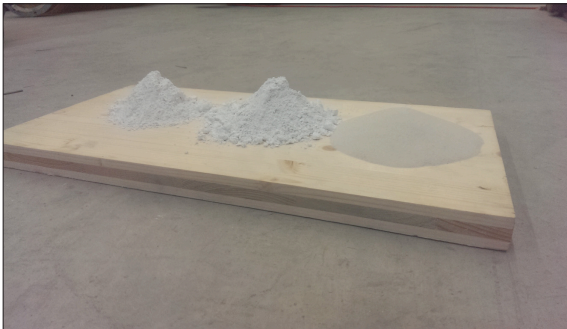
Die drei Quarzsande, mit denen die GUS-Fracht simuliert wurde