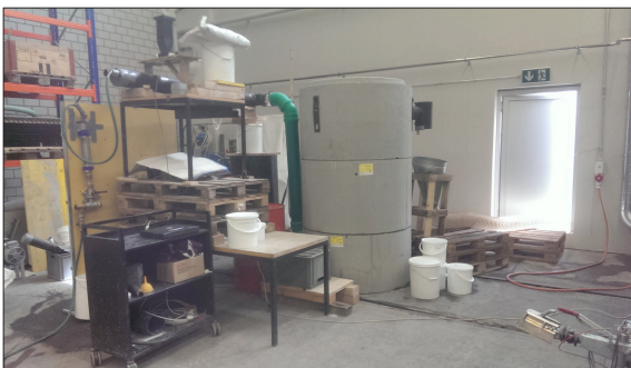
Versuchsaufbau zur Analyse der Abscheideleistung von GUS

Ausgangslage: Die allgemeine Anforderung an die Qualität des Abwassers in der Schweiz ist sehr hoch. Zu den potentiell schädlichen Stoffen im Abwasser gehören die gesamten ungelösten Stoffe (GUS), an denen oft bestimmte Schadstoffe, insbesondere Schwermetalle, adsorbieren und so in den Vorfluter gelangen. Der Höchstwert von GUS für Abwasser liegt bei 20 mg/l und wird in bestimmten Fällen überschritten. Beispielsweise kann Sickerwasser von Inertstoffdeponien oder Kieswaschwasser höhere GUS aufweisen, sodass eine effiziente Partikelabscheidung gefordert ist.