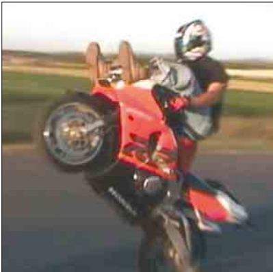
Ziel: Automatische Regelung eines Wheelies

Aufgabenstellung: Als weiterführende Arbeit zur Studienarbeit «Wheelie Control - Eine Studie» sollen die dort gewonnenen Erkenntnisse über geeignete Sensoren und Aktoren umgesetzt werden, um ein Motorrad auf dem Hinterrad zu balancieren. Der Fokus der Arbeit liegt darauf, mögliche Regelstrategien und Reglerstrukturen aufzuzeigen und ihre Vor- und Nachteile theoretisch und anhand von Simulationen zu diskutieren. Die am besten geeignete Lösung soll anschliessend mit einem MSP430 Mikrocontroller an einem Motorrad realisiert werden.