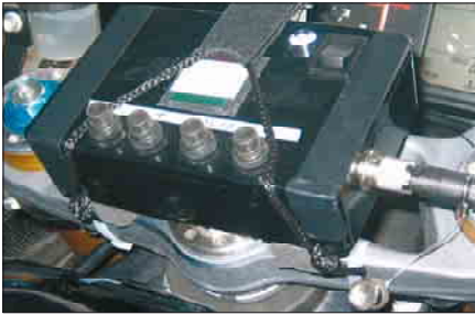
Sensor und Elektronik auf der Gabelbrücke