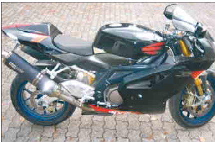
Testmotorrad: Aprilia RSV 1000 R Factory