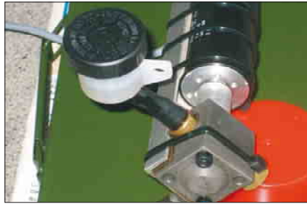
Hydraulikpumpe zur Erzeugung des Bremsdrucks