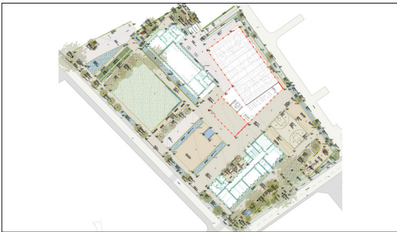
Ausführungsplan Massstab 1:100 Eigene Darstellung