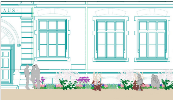
Detailplan Massstab 1:20 Eigene Darstellung