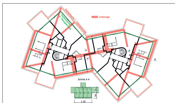
Grundriss des achten Obergeschosses (Aufstockung)

Ausgangslage: Das in den Siebzigerjahren durch den Zürcher Architekten Werner Stücheli erbaute Haus zur Enge soll umgebaut werden. Das bestehende Bauwerk erstreckt sich über vier Untergeschosse, das Erdgeschoss und sieben Obergeschosse. Über diese zwölf Geschosse sind der Ersatz der Fassaden, ein Teilrückbau und Wiederaufbau der Wohntrakte sowie der Umbau für das FIFA-Museum im Sockelbereich geplant. Auf dem Dach über dem siebten Obergeschoss sind weitere Geschosse mit Wohnungen und zwei kleinere, unabhängige Technikgeschosse geplant. Das Ziel dieser Arbeit bestand darin, ein Tragwerkskonzept für die Aufstockung zu erarbeiten und dazu statische Berechnungen auf der Stufe Vorprojekt durchzuführen.