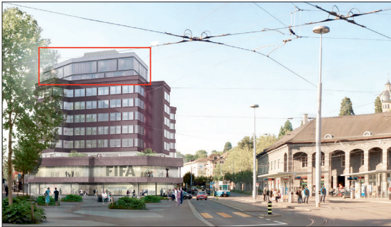
Visualisierung Haus zur Enge mit Aufstockung