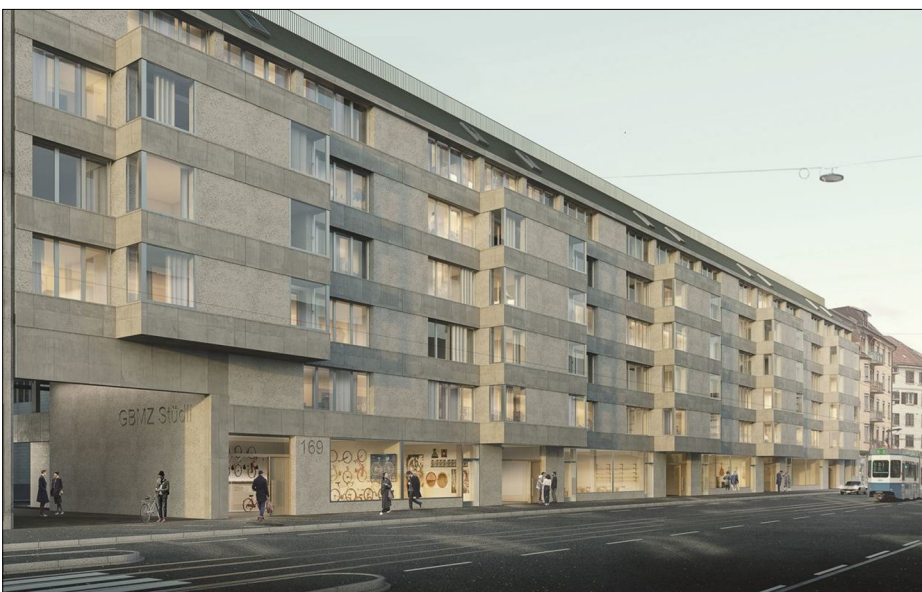
Siedlung 6, Stüdlweg (ZH) https://gbmz.ch/siedlungen-und-projekte/ersatzneubau-siedlung-6/

Die Varianten der Energieversorgung wurden zusammen mit den anderen (parallel von einem externen Anbieter entwickelten) in die Bewertungstabelle aufgenommen und werden vor der endgültigen Wahl durch das Unternehmen berücksichtigt.