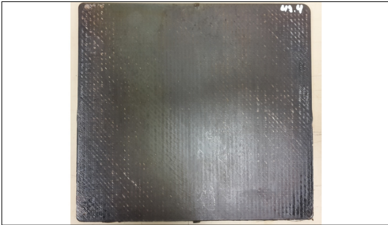
Glasfaser-Tannin-Platte im RTM-Verfahren

Ziel der Arbeit: Ziel dieser Arbeit ist, mit Hilfe der Infusion- und Resin Transfer Molding RTM-Prozesse, auf Tannin basierende Bio-Composite Platten herzustellen. Im Verlauf der Arbeit werden die Herstellungsprozesse aufgezeichnet und optimiert. Aus dem Vergleich mit einer Referenzplatte aus Epoxidharz sind die Tanninsysteme mechanisch zu charakterisieren.