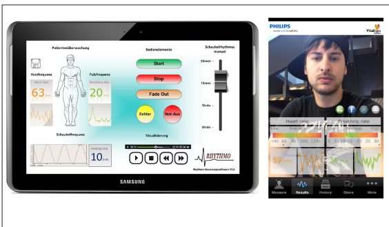
HMI/Vital Signal Camera zur Überwachung von Puls und Atmung

Ergebnis: Ein ausführliches Konzept für das Human-Maschinen-Interface (HMI) wurde erstellt. Die Verarbeitung der physiologischen Signale wurde in der Steuerung implementiert. Die Kommunikation vom HMI zur Steuerung funktioniert einwandfrei und kann zukünftig erweitert werden. Es ist auch bewiesen, dass die innovative Art der Pulsmessung per Kamera funktioniert. Analyse der Wirkung von Virtual Reality.