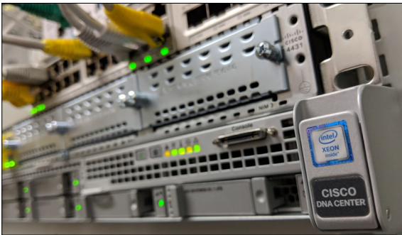
DNA Center Appliance

Aufgabenstellung: Ziel dieser Studienarbeit war die Evaluation des Cisco Digital Network Architecture (DNA) Center, der Software-Defined Network (SDN) Lösung von Cisco, für die Führungsunterstützungsbasis (FUB) der Schweizer Armee. Das DNA Center ist eine Softwarelösung zur Netzwerkautomatisierung. Diese vereinfacht und automatisiert das Deployment und Management einer Campus Netzwerk Umgebung mit Hilfe von Technologien wie VXLAN und LISP. Durch die zentrale Verwaltung der Infrastruktur wird die Qualität und Sicherheit der Netzwerkumgebung stark erhöht.