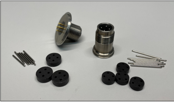
Glasdurchführungen der Firma Eldur Eigene Darstellung

Problemstellung: Die Firma Eldur AG der Dietze Group stellt Hochpräzisions-Glasdurchführungen her. Die Glasdurchführungen werden heute von Hand bestückt. Um eine hermetisch dichte Verbindung zu erreichen, werden die Gläser nach der Bestückung in einem Ofen eingeschmolzen. Zurzeit kann der Ofen nicht optimal ausgelastet werden. Durch die manuelle Bestückung ist die Herstellung in der Schweiz nicht wirtschaftlich. Die Firma Eldur ist aus diesem Grund daran interessiert, den Prozess der Bestückung zu automatisieren.