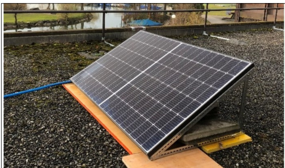
Abbildung 2: Aufbau des Solarpanels auf einem Gebäudedach der OST in Rapperswil. Eigene Darstellung