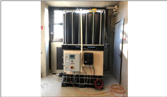
Abbildung 1: GDM-Anlage mit zwei übereinanderstehenden IBC-Behälter und seitlich montierter Steuerung.