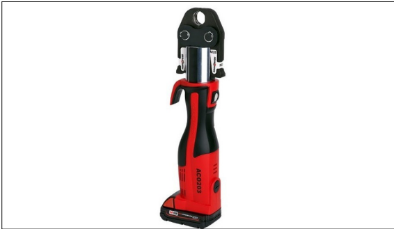
Marktübliches Pressgerät

Ausgangslage: Beim Fügen von Trinkwasserrohrleitungen werden heute meist Pressverbindungen verwendet. Um diese Pressverbindungen zu realisieren, werden elektrisch angetriebene Pressgeräte eingesetzt.